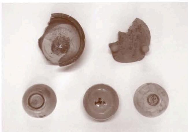
本部構内出土の尾張藩屋敷関連資料

1889(明治22)年、京都吉田の地に第三高等中学校が大阪から移転してきました。この地は、京都帝国大学の創立とともに、京大の本部構内となります。この吉田の地に高等教育機関が置かれてから今年でちょうど百三十二年となるのを記念して、幕末この場所にあった尾張藩屋敷までさかのぼって、吉田キャンパスの成立史をたどっていきます。