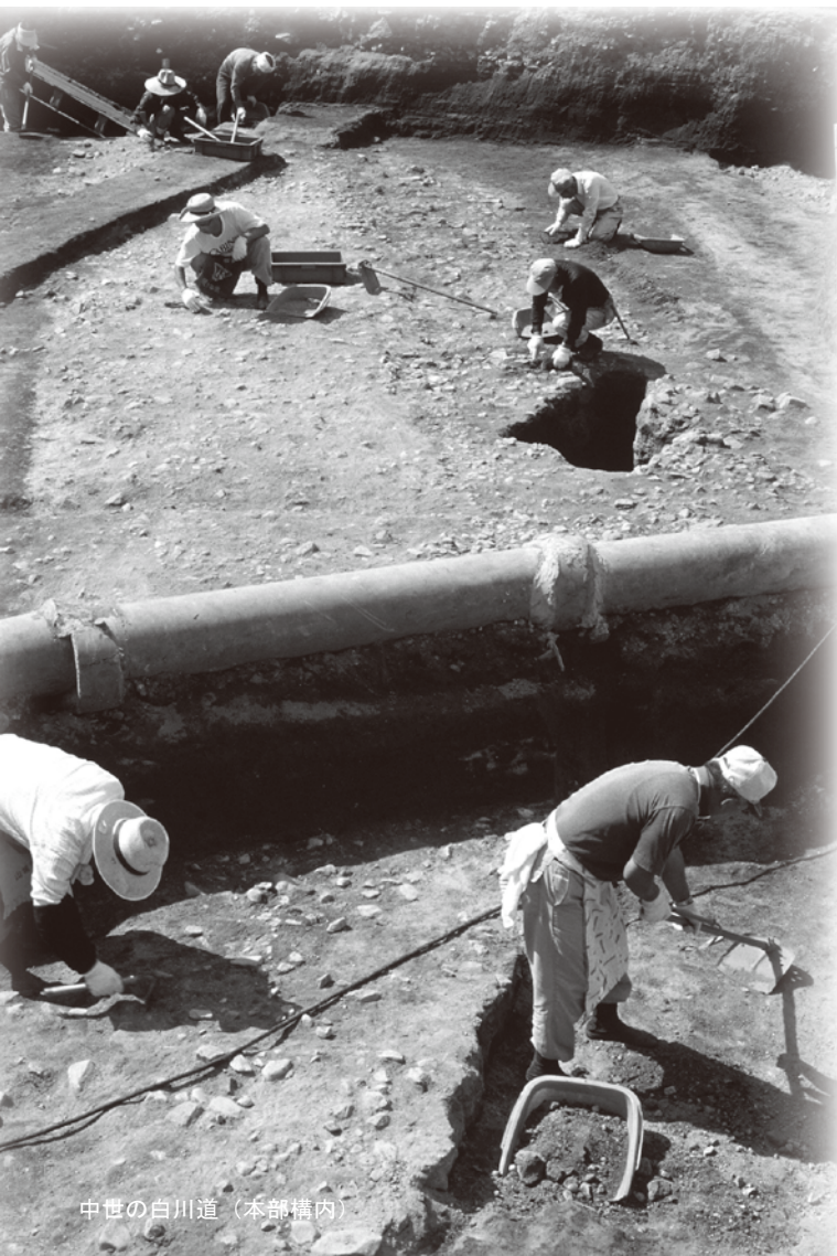
中世の白川道（本部構内）