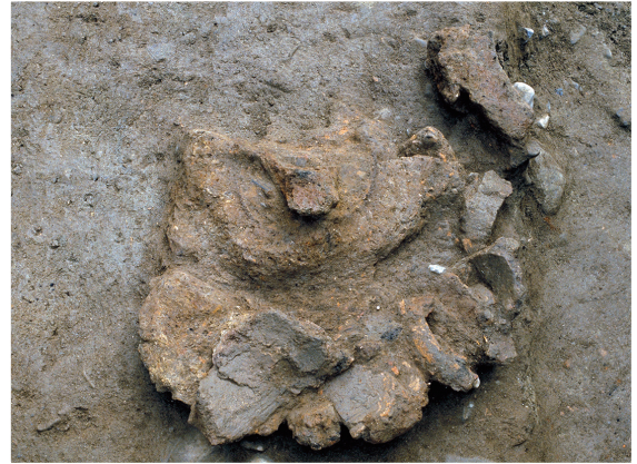
梵鐘鑄造遺構 Mould for casting a temple bell