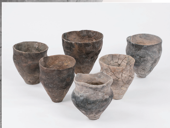
縄文土器・深鉢 Deep Jars