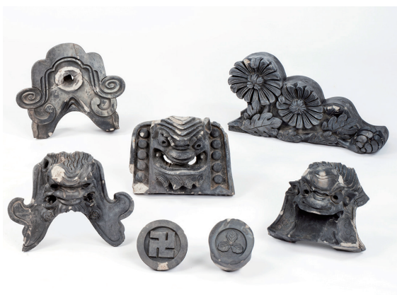
徳島藩邸比定地出土の鬼瓦ほか Terminal roof-tiles