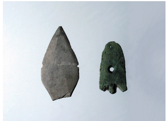
磨製石鏃（左）・銅鏃（右） Left : Ground stone arrowhead Right : Bronze arrowhead