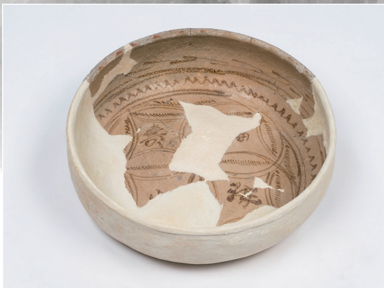
黄釉陶器鉄絵の盤 Imported stoneware