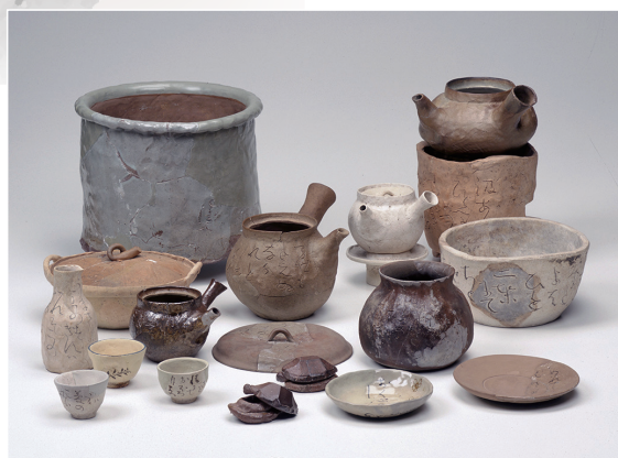
蓮月焼 Rengetsu ware