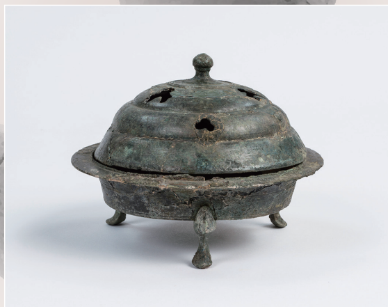
火舎香炉 Bronze cassolette