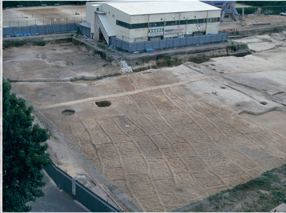
水田跡 Paddy field