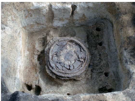
梵鐘鑄造遺構 Pit for casting a temple bell