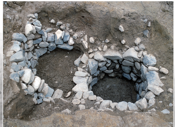
つくりかえた井戸 Wells with an overlap