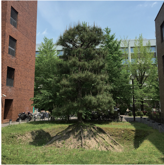
火葬塚（復元） Cremation monument