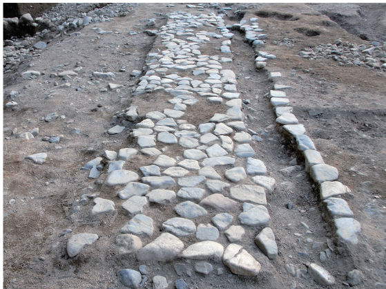
建物北側の石敷き Pavement around the Buddhist hall