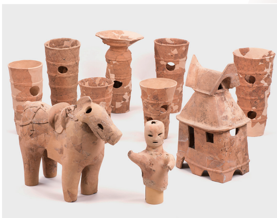
埴輪 Haniwa : ceramic funerary sculpture