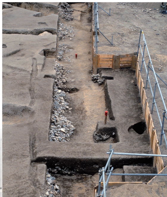
土佐藩邸の南限を画する堀 Ditch of the Tosa garrison