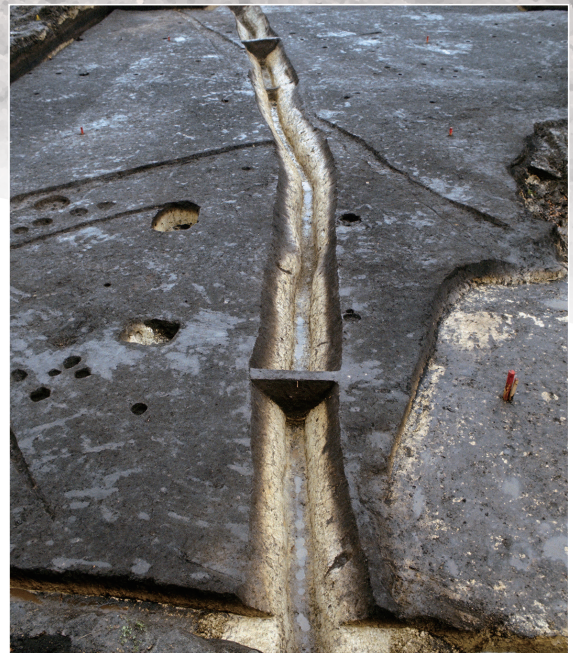
V字溝 Ditch with a V-shaped profile