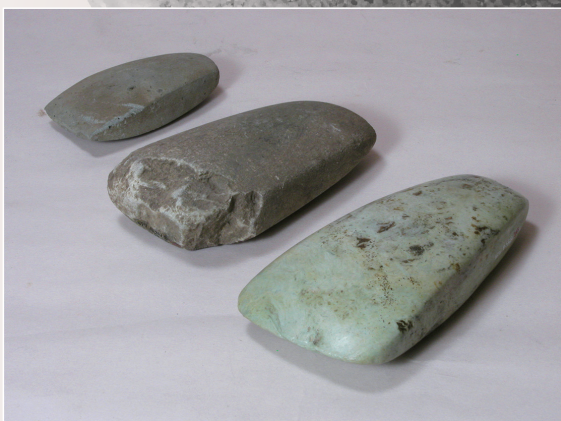
磨製石斧 Ground Axes