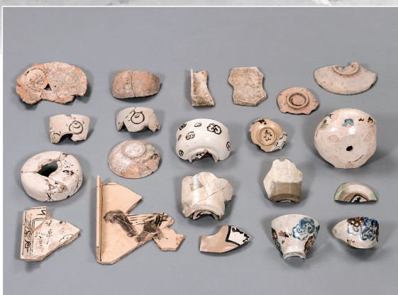
乾山焼 Kenzan ware