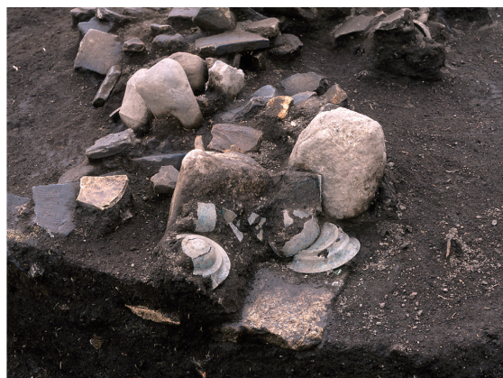
経塚遺構 Remain of the dedicatory chamber