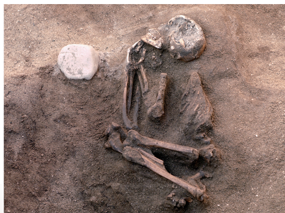
人骨 Crouched inhumation