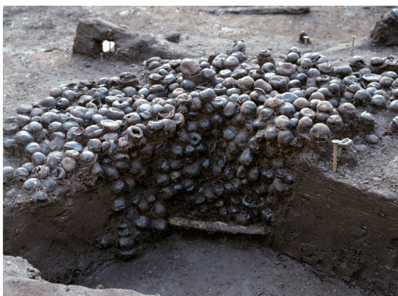
トチノミの貯蔵穴 Storage Pit