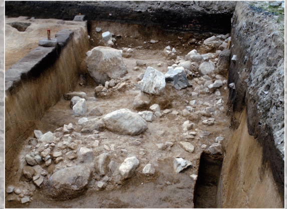
土石流 Debris flow