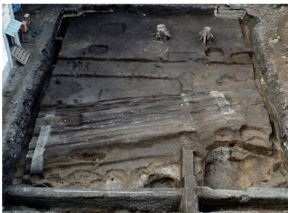
轍の残る白川道 Shirakawa road