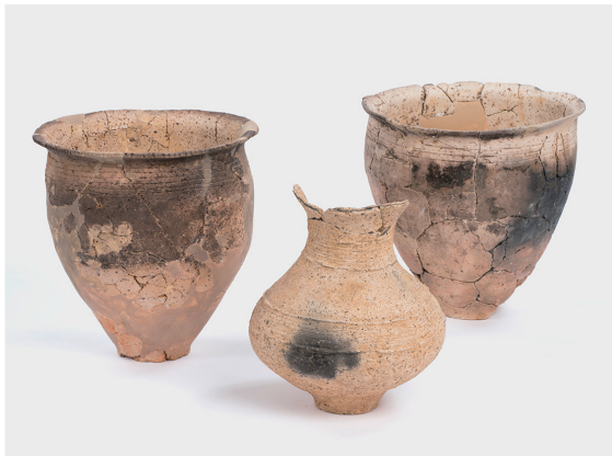
甕と壺 Pottery assemblage