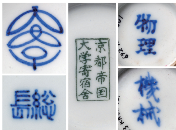
京都帝国大学関連遺物の銘 Seals of Kyoto University on porcelain