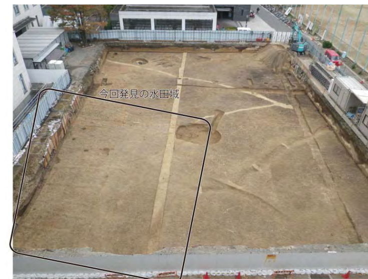
参考：今回発見の水田遺構（東から）