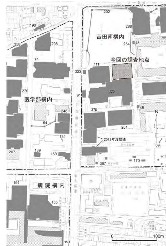
図1 今回調査地点の位置（上が北・縮尺約1/5000）

弥生前期の水田は、西日本でほかにいくつか知られておりますが、今回は、ごく一時期と想定される洪水砂層に覆われ、田面や周辺地形が当時のままとみられるきわめて良好な状態をとどめている点、資料価値の高いものといえます。日本列島で稲作が本格的に始められたといえる弥生前期の、水田を作る技術や知識、当時の人々の地形環境への対応の仕方などを、具体的に知ることのできる貴重な事例と評価されます。