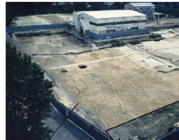
1994年調査時の水田遺構（北東から）