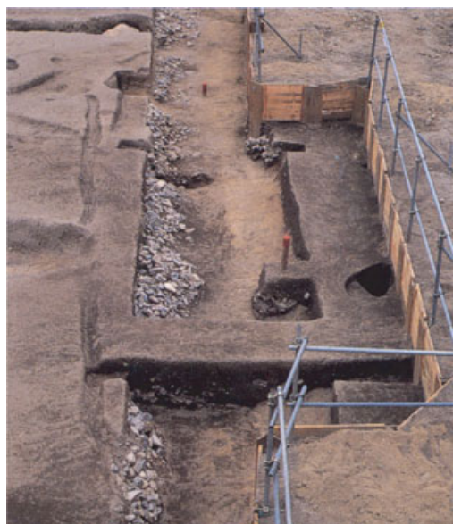
土佐藩邸の南限を画する堀（北部構内）

このほか構内では、旧制高校や帝国大学関係の資料もしばしば出土する。文字記録としては残されていない例もあり、考古学的手法によるこうした時代の研究も、今後重要性を増してくるであろう。