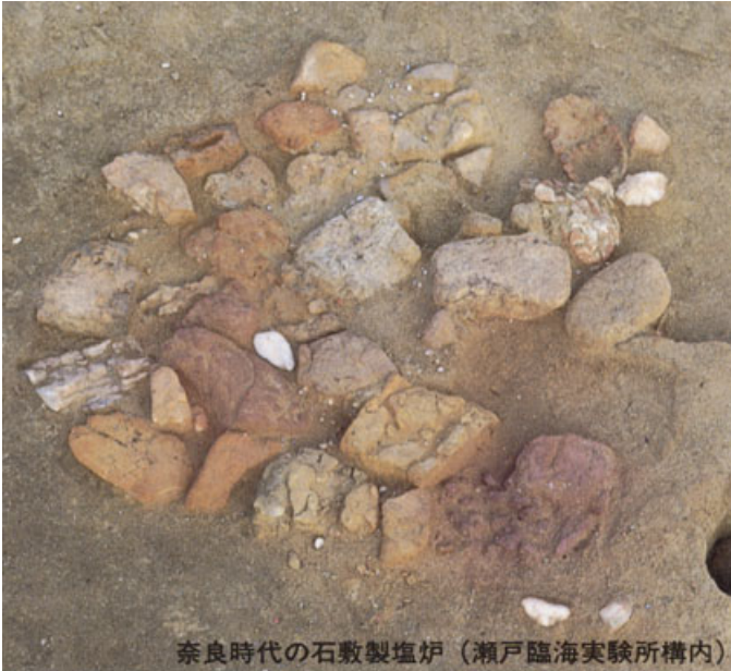
奈良時代の石敷製塩炉（瀬戸臨海実験所構内）