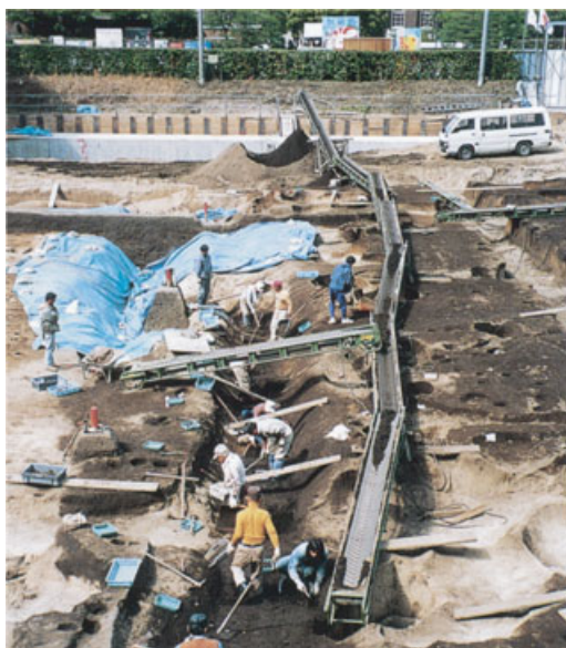
発掘中の遺跡（総合人間学部構内）

百年を越える学問と研究の空間が形成されてきた本学のキャンパスは、埋蔵文化財のほかに歴史的建造物も多く残されており、それらと調和のとれた共存をはかりながら新たな歴史を刻む方法を模索し実践するうえで、またとない場である。計画的な発掘調査と、調査成果にもとづいた保存修景は、そのためにもきわめて重要な役割を果たすものである。今後とも、学内各部局の方々の御協力をお願い申し上げる次第である。