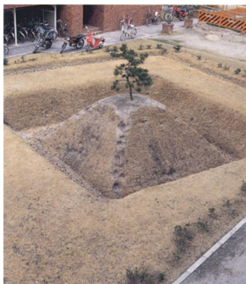
復元整備後の鎌倉時代の火葬塚（北部構内）