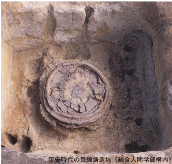
平安時代の梵鐘鑄造坑（総合人間学部構内）