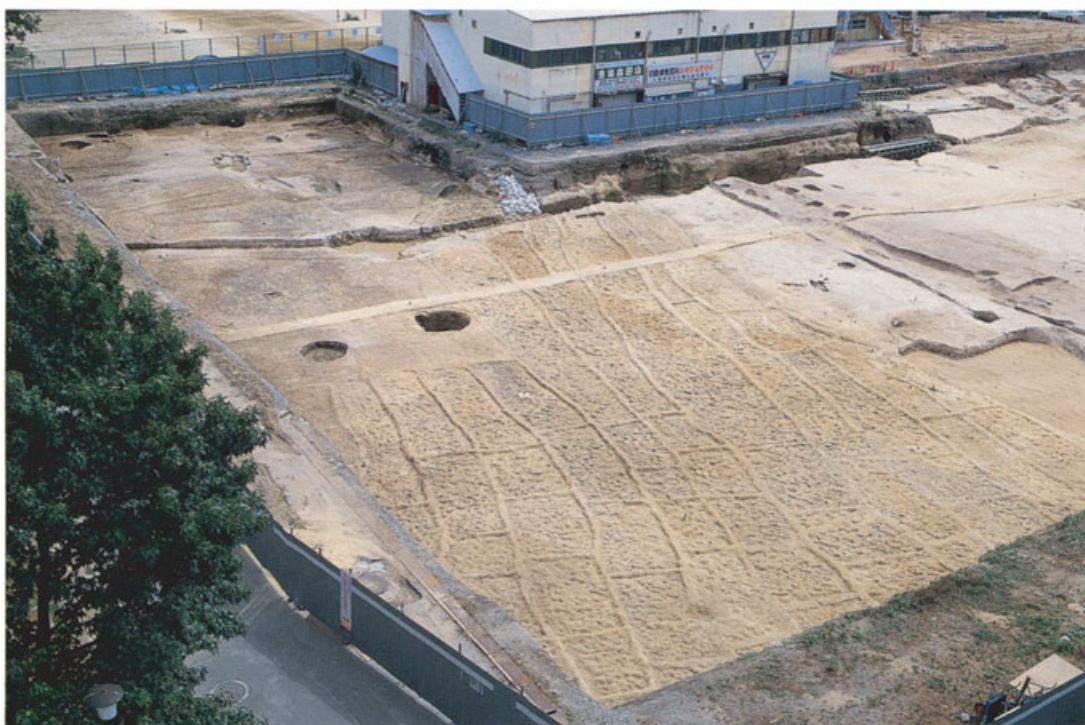
弥生時代前期の水田跡（総合人間学部構内）