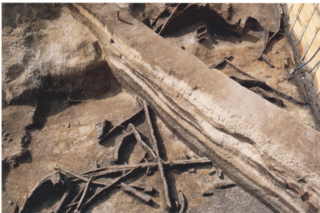
縄文時代晩期の低湿地に残る埋没林。中央の土手は土層観察用の畦（北部構内）

弥生時代の遺跡については、総合人間学部構内で、今から約2200年前の前期の水田や流路が見つかっており、本部構内や北部構内でもこの時期の資料が多く出土しているほか、北部構内では中期の方形周溝墓が