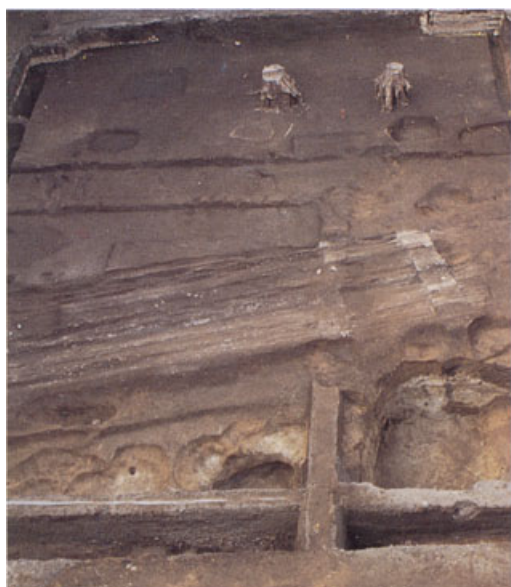
轍の残る近世白川道の遺構（本部構内）

聖護院村の北辺にあたる病院構内南辺には、幕末の歌人 おおた がきんげつ 太田垣蓮月（1791～1875）