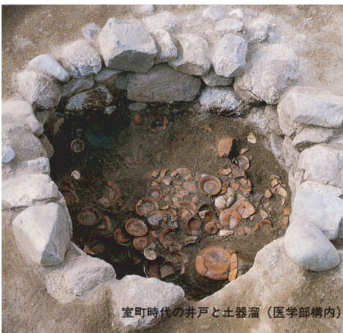
室町時代の井戸と土器溜（医学部構内）