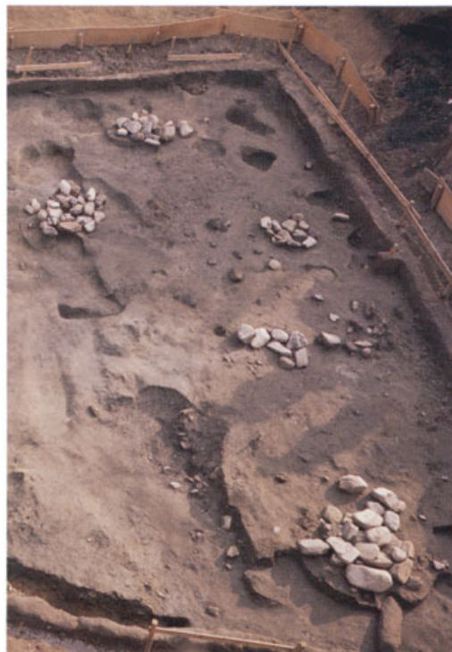
縄文時代後期の配石墓（北部構内）

また、和歌山県白浜町の理学部附属瀬戸臨海実験所構内の瀬戸遺跡は、縄文時代晩期～弥生時代前期の土器や人骨が出土し、南紀における弥生時代の始まりを考えるうえで重要な遺跡である。このほか、京都府丹波町の農学部附属牧場構内に所在する美月遺跡でも中期～後期の水路や土坑がみつかり、大阪府高槻市の農学部附属高槻農場も、弥生時代の拠点集落として学史上著名な安満遺跡の上に位置している。